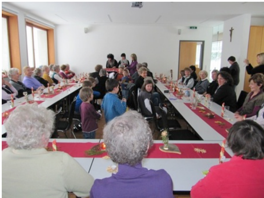
Archivfoto der Frauenbewegung Buch

Die Frauenbewegung Buch ladet alle Bucherinnen und Bucher zu einer besinnlichen Adventfeier, am Freitag, den 13. Dezember 2013 recht herzlich ein.