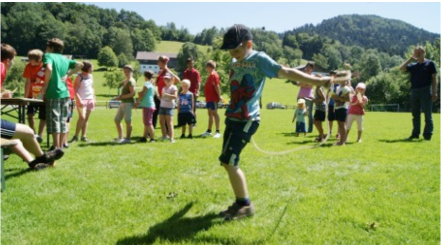
Archivbild: Ministrantenolympiade 2011

Wie in den vergangenen Jahren findet diese Veranstaltung am Fronleichnamstag (Donnerstag, 19.06.2014) ab 14:00 Uhr beim Sportplatz vom SV-Buch statt. Für ausreichende Verpflegung in Form von Gegrilltem, Kuchen und Getränken ist jedenfalls gesorgt.