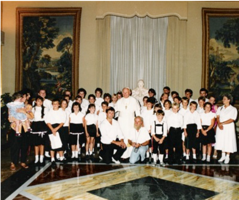
1990: Privataudienz beim Papst Johannes Paul II