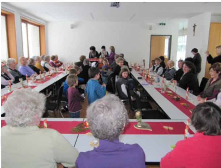
Archivbild: Adventfeier 2010

Gerne würden wir die Vereinsführung in andere Hände geben um so den Fortbestand zu sichern.