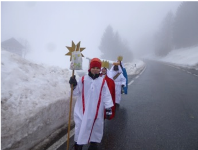
Kälte und Nässe konnten die Sternsinger nicht bremsen