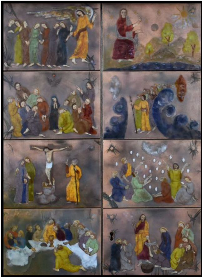
Tabernakeltüren von Gertrude Stöhr, 1953