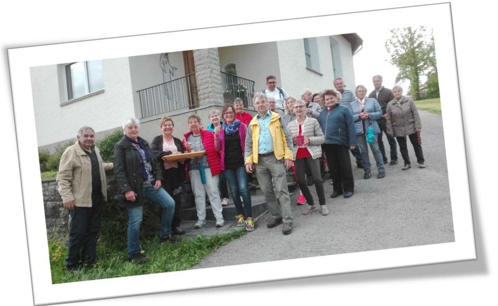
Die „Pilger“ vor der Kapelle am Fischbach