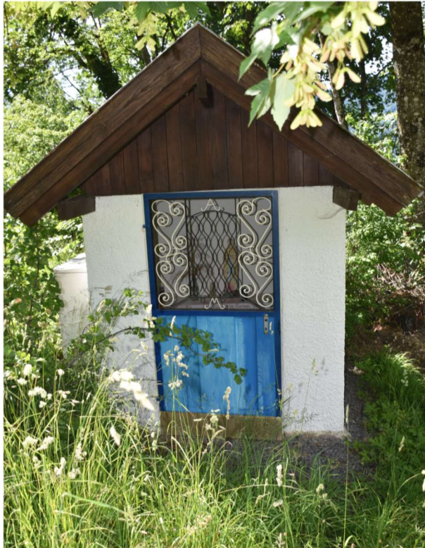
Bildstock Parzelle Gartland