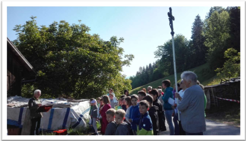
Bittgang–Endstation auf der Egg