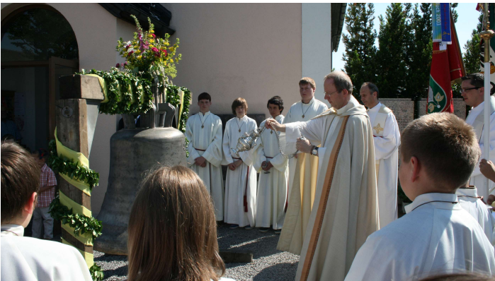
Glockenweihe am 27. Juni 2010 als würdiger Abschluss der Kirchenrenovierung