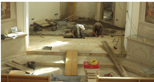
Verlegung der Bodenplatten durch Arbeiter der Firma Lenz