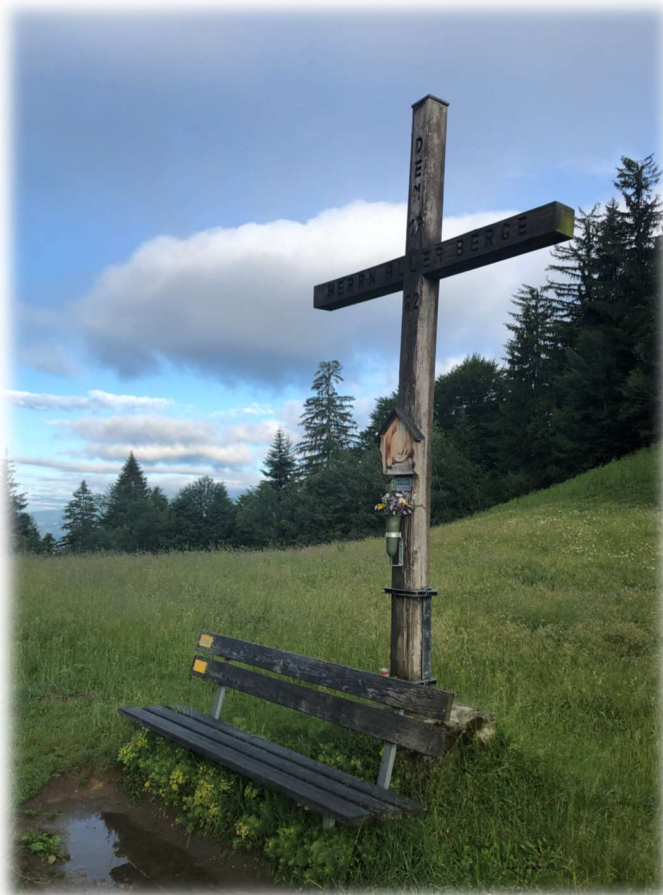
Gipfelkreuz am Schneiderkopf