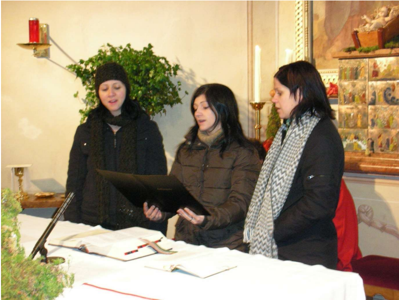
Gesungenes Weihnachtsevangelium 2006