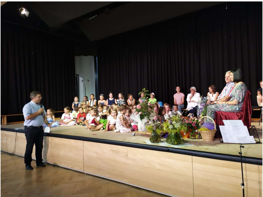
Verabschiedung Anfang Juli 2020 im Gemeindesaal