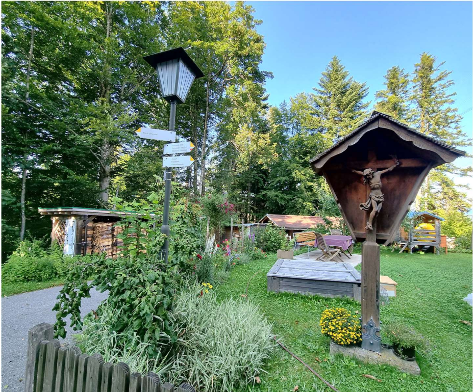
Wegkreuz im Tobel bei Fam. Flatz